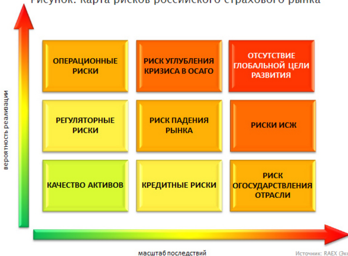
Рисунок. Карта рисков российского страхового рынка