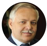
Владимир Сенин, председатель подкомитета по устойчивому развитию и зеленому финансированию комитета по финансовым рынкам, Госдума РФ